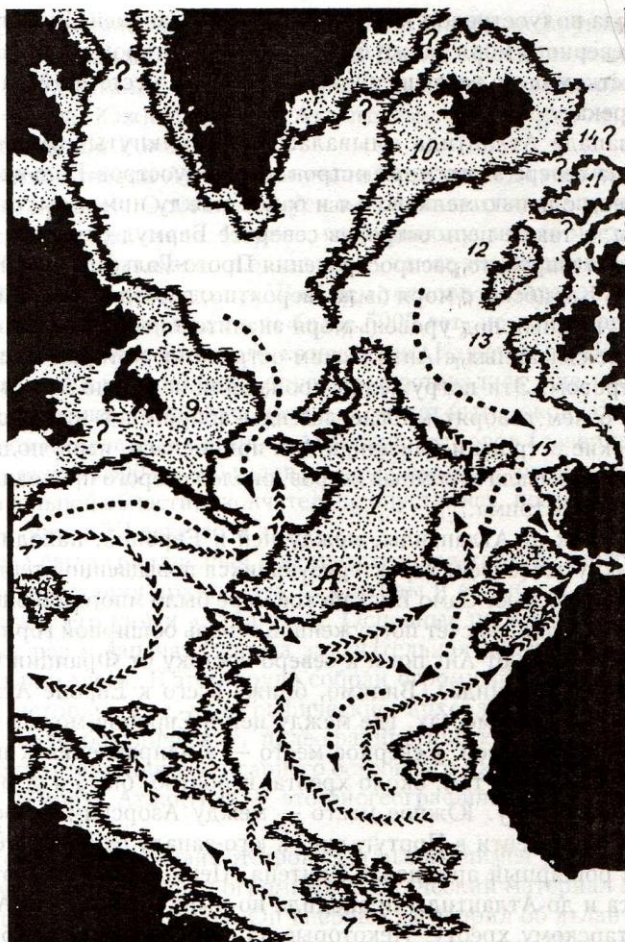
Палеогеографическая реконструкция Большой Атлантиды (15 000 – 10 000 лет до н.э. по Н. Жирову. А – вероятное местонахождение главного царства Атлантиды (царство Атланта). 1 – о. Азориды; 2 – о. Антилия; 3 – о. Тартесс; 4 – о. Канария; 5 – о. Мадейра; 6 – о. Зеленомысный; 7 – Экваториальный архипелаг; 8 – о. Бермуда; 9 – о. (или полуостров) Большой Ньюфаундленд; 10 – о. Большая Исландия; 11 – о. Фарер (Туле?); 12 – о. Роккол; 13 – п-ов Бразил; 14 – порог Томсона; 15 – п-ов Оловянный. Стрелками показаны направления теплых и холодных (пунктир) течений.

По мнению Жирова, Атлантиду можно представить как меридиально расположенный материк, скорее длинный, чем широкий, и состоящий из трех основных частей: более широкого северного острова на базе Азорского плато – Посейдонида или Азориды, узкого и длинного южного острова Антилия и Экваториального архипелага, остатком которого являются скалы острова Сан-Паулу. Посейдонида и Антилия были отделены при 31^\circ с. ш. узким проливом, которому Жиров дал наименование пролив Посейдона. Вероятно, где-то между 5 и 10^\circ с. ш. один или несколько узких проливов отделяли Антилию от Экваториального архипелага.